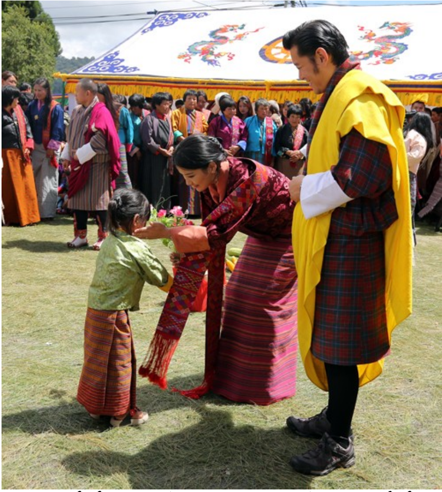
གཞུང་གིས་སྤྱི་འབྲེལ་ལུ་ མི་དབང་མངའ་བདག་རིན་པོ་ཆེ་མཚོག་གིས་གཞུང་གིས་སྤྱི་འབྲེལ་ལུ་བཟོ་བྱེད་ཅི་ལུ་སྤྱི་འབྲེལ་ལུ་བཟོ་བྱེད་ཅི་ལུ་བཟོ་བྱེད་ཅི་ལུ་

མི་དབང་མངའ་བདག་རིན་པོ་ཆེ་མཚོག་གིས་གཞུང་གིས་སྤྱི་འབྲེལ་ལུ་བཟོ་བྱེད་ཅི་ལུ་ སྤྱི་འབྲེལ་གནང་ཡོད་པ།