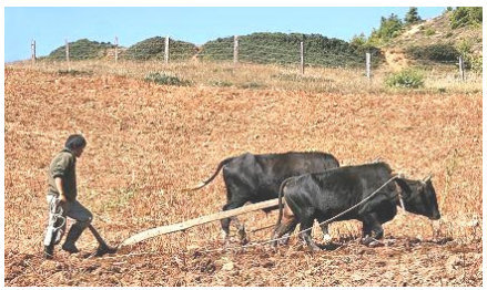
རྫོང་འགལ་ཁྲིམ་སྡེ་ཚོགས་ཚུང་གིས་ བཀོད་རྒྱ་ ཐོབ་པའི་འུལ་ལུ་ རྫོང་གཞི་གི་ནང་འཁོར་

ད་ལྟོ་འདི་ལུ་འབད་བ་ཅིན་ ལྷན་ཚོགས་ལེ་ཀར་༡ ལུ་སྤྱི་དོ་༣ དང་ རྒྱའི་ལེ་ཀར་༡ ལུ་ སྤྱི་དོ་༤ གྲེ་ཅིས་སྤོལ་ཡོད་པ་ཡིན།