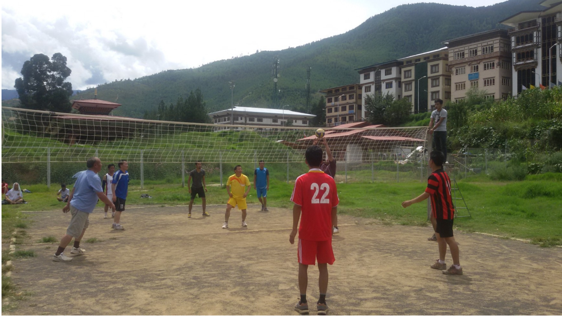
འབྲུག་འཛི་ཅན་གྱི་ལས་རིམ་ཡོད་རུང་ སྤོད་འཆམ་ལས་རིམ་གྱི་དུས་ཚོད་བཟོ་ཡོད་པ། ངལ་གསོལ་འདྲི་སྐབས་ལུ་ ལྷང་གྲིང་ཐང་ནང་སྟེ་ རྒྱལ་ཡོངས་ས་ཆ་ལྷན་ཚོགས་ཡིག་ཚང་གི་ལས་བྱེད་པ་ཚུ་གི་བར་ན་ བུང་འཁོད་ལག་རྩལ་འགྲན་བསྐྱར་འགོ་འདྲེན་འབྲེལ་ཡོད་པ།