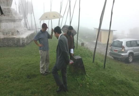
ཇའི་ཀ་སྟེ་ཚོད་དེ་གིས་ ད་ལྟོ་ཡོད་པའི་ ཚད་འཛིན་ ས་ཁོངས་འབྲེལ་གཞུག་ས་གནས་ཚུ་ བཟོ་ཞིབ་འབད་བར་ རྒྱ་ཚབ་ཚོགས་ལུ་གཞིགས་བསྐྱོར་འབྱོར་ཡི།

རྒྱ་ཚབ་ཚོགས་པ་གིས་ འབྲུག་ལུ་ས་ཆ་དང་ས་ཁྱོན་གི་ གནས་ སྟངས་ལག་ལེན་འབྲེལ་མི་ ལས་སྡེ་མང་ཤོས་ཚུ་ནང་དགོས་མཁོ་འདི་ བརྟག་ཞིབ་དོན་ལུ་ གཞིགས་ཞིབ་འབད་དེ་ ལས་འགུལ་ས་ གནས་ཀྱི་ གནས་སྟངས་ཉ་གོ་ཞིའི་དོན་ལས་ རྒྱ་ཚབ་ཚོགས་ རྒྱུང་ལུ་གཞིགས་བསྐྱོར་གནང་ཡི། གོ་སྐབས་ཞལ་འཛོམས་གོ་རིམ་སྟེ་ཚོགས་པའི་ལུལ་ལུ་ ལྷ་ ཚེས་༢༥/༠༧/༢༠༡༥ ལུ་ རྒྱལ་ཡོངས་ས་ཆ་ལྷན་ཚོགས་དང་ ཇའི་ཀ་གི་བར་ན་ ཞལ་འཛོམས་ཀྱི་གོ་སྐབས་ཚོད་གུར་ མཚན་ ཉམས་བཞེད་གནང་ཡི།