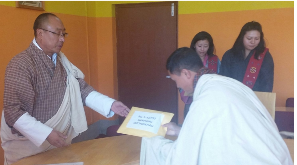
དུང་ཚེན་མཚོག་གིས་ རྫོང་ཁག་ས་ཆ་ཐོ་བཀོད་འགོ་དཔོན་ཚུ་ལུ་ སྤྱི་ལོ་ལྷན་འཁོར་གྱི་ལྷན་འཁོར་སྤོད་པའི་བསྟུན།

སྤྱི་ཚེས་ ༢/༡༢/༢༠༡༦ ལུ་ ལྷན་ཚོགས་ཡིག་ཚང་གིས་ མགར་ས་དང་ རྩེ་ གསར་སྤང་བསམ་ཚེ་ ཐིམ་ཕུག་རྫོང་ཁག་གི་ ས་ཁྲུལ་སྟེ་ ཚོན་ཚུ་ལུ་ སྤྱི་ལོ་ལྷན་འཁོར་དེ་ཚུ་སྤོད་འབད་ཡི།