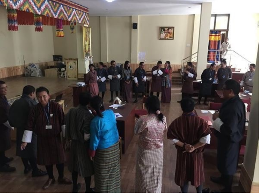
སྤྱོད་བདར་ནང་བཅའ་མར་གཏོགས་མི་ཚུ་གིས་ མི་ཚོ་ནང་བད་དོན་སྤྱོད་ལེན་འབད་ཐངས་འགའ་ཚེ་བའི་སྐོར་ལྷབ་པའི་བསྐྱར།

འཛིན་སྤྱོད་སྤོབ་སྤེ་ཚད་འཛིན་གྱིས་ ས་ཆ་ཐོ་བཀོད་པ་དང་ ས་འཇལ་བཟོ་རིག་འགོ་དཔོན་ས་འཇལ་པ་ཚུ་བཅུམ་ཉེ་ ལྷན་ཚོགས་ཡིག་ཚང་གི་ལས་བྱེད་པ་ ༣༠ ལུ་ བད་དོན་སྤྱོད་ལེན་དང་ གསལ་ལུ་ མི་མང་ལུ་གསལ་བཤད་འབད་ནི་གི་རིག་ཅུལ་སྤྱོད་བདར་ཅིག་ ཉིན་མ་ ༥ གི་རིང་འགོ་འདྲེན་འཐབ་ཡོད། སྤྱོད་བདར་ལས་རིམ་ནང་ བད་དོན་སྤྱོད་ལེན་དང་ མི་མང་གི་གཏོང་ཁར་གསལ་བཤད་འབད་ནི་ལུ་ དགོས་མཁའི་ བསམ་གཞི་སྤུ་ཚོགས་ཡོད་མི་ཚུ་ཉ་གོ་དགོ་པའི་སྐོར་ལས་ལྷབ་ཡོད་པ་ད་ སྤྱོད་བདར་མཇུག་བསྟུ་བའི་ལུལ་ལས་ གཤམ་འཁོད་ཀྱི་གྲུབ་འབྲས་ཚུ་འབྲུང་ཚུགས་པའི་དམིགས་ལུལ་ལུ་འབད་འགོ་འདྲེན་འཐབ་ལུག།