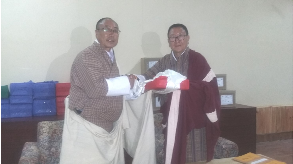
རྩིས་སྤྱོད་སྤེ་ཚུ་གིས་ ཐིམ་ཕུག་རྫོང་ལག་ལུ་ ལག་ཞལ་གསར་པ་རྩིས་སྤོང་པའི་བསྐྱེད་པ།