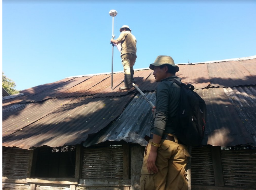
ཇི་མོ་གཙང་ཁའི་ ས་གནས་ས་ཁོངས་འཆར་གཞི་བཅད་མཚམས་བཀོད་བའི་བསྟན།

རྟེ་མ་ ཡོངས་གྲགས་ལུ་ དྲའི་ཕམ་ཟེར་སྤྱབ་ སྤེལ་ཡོད་མི་ ཇི་མོ་གཙང་ཁའི་འདི་ འབྲུག་གི་ ཤར་ལྷོ་ལུང་ཕྱོགས་ལུ་ རྒྱ་གར་གྱི་མངའ་སྤེལ་ སམ་དང་ ཨ་རུ་ན་རྒྱལ་པར་དེལ་ ༩ དང་ རྒྱལ་སྤྱི་ས་མཚམས་མཐུད་དེ་ཡོད་མི་བསམ།