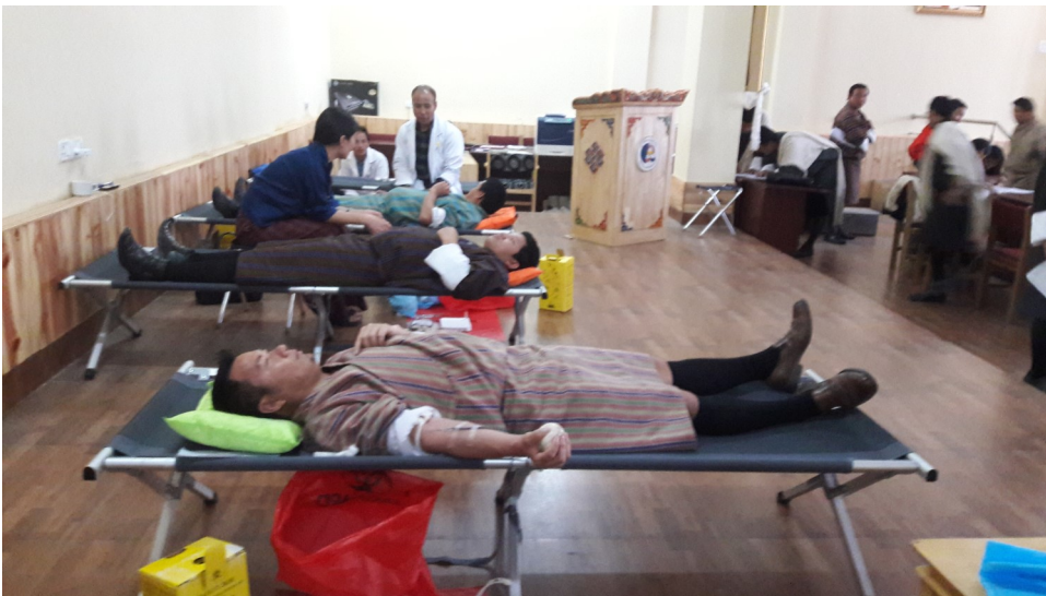
ས་ཚ་ལྷན་ཚོགས་གྱི་ལས་བྱེད་ཚུ་ཞུག་ཞལ་འདེབས་ནང་བཅའ་མར་གཏོགས་པའི་མཐོང་སྤང་།

མིའི་ཚེ་སློག་ལུ་སློག་སྤོང་བཞག་འབད་ཚུགས་པའི་ ཐབས་ལམ་ལུ་ ཞུག་ཞལ་འདེབས་ཞུག་ཆེ་བའི་ རྗེ་དབང་ལོ་ལོ་ལོ་ལོ་ལོ་ ས་ཚ་ལྷན་ཚོགས་གྱི་ ལས་བྱེད་ཚུ་གིས་ཁས་བྲལ་ཐོག་ འཛིགས་