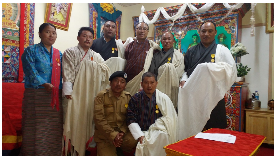
དགོས་དུང་ཚེན་མཚོག་གིས་དབུ་གཙོས་པའི་ གཞི་གཡོག་གཟེངས་བསྟོད་འཐོབ་མི་ཚུ།

གཞི་གཡོག་གི་བཅའ་ཡིག་དང་སྤྱི་གཞི་གཞི་ ༢༠༡༢ ཚན་མ་དང་འཁྲུལ་ཏེ་ ལོ་ངོ་ ༡༠ དང་ ༣༠ ༣༠ ལས་ལྷན་གྱི་གཞུང་གཡོག་ནང་ཕུག་ལུ་མི་ལས་བྱེད་པ་ཚུ་ལུ་ གཞི་གཡོག་གཟེངས་བསྟོད་ཀྱི་ལག་ཁྱེར་དང་ ཟངས་དང་ དདུལ་ གསེར་གྱི་རྟགས་མ་ཚུ་གནང་ཡོད།